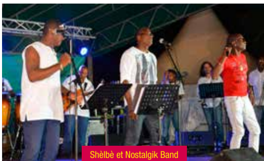
Shèlèbè et Nostaljik Band