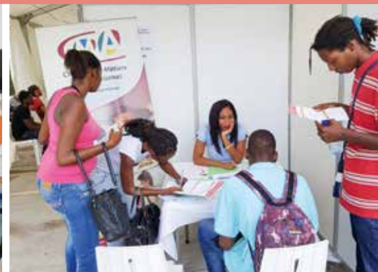
La jeunesse au cœur de l'action municipale