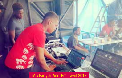
Mix Party au Vert-Pré - avril 2017