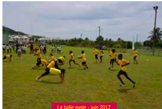
La balle ovale - juin 2017