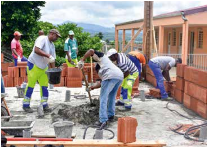
Poursuite des travaux d'extension de l'école de Café