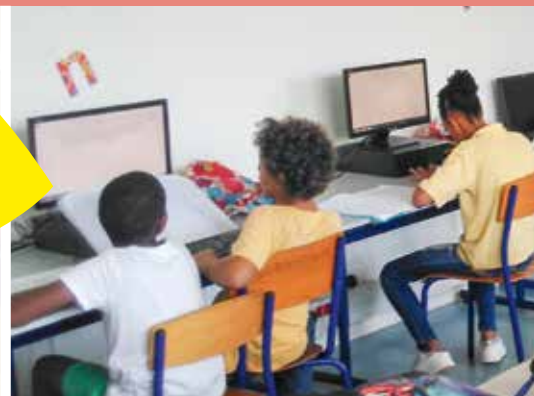
L'informatisation des écoles