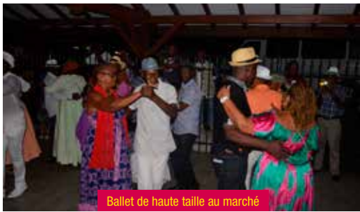
Ballet de haute taille au marché