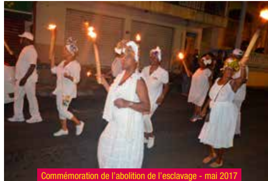
Commémoration de l'abolition de l'esclavage - mai 2017