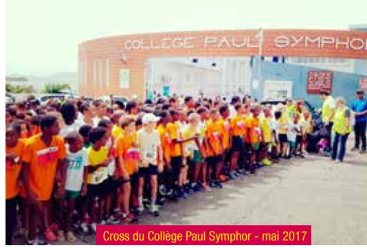
Cross du Collège Paul Symphor - mai 2017