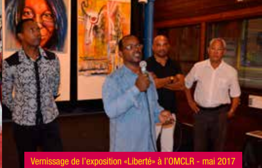
Vernissage de l'exposition «Liberté» à l'OMCLR - mai 2017