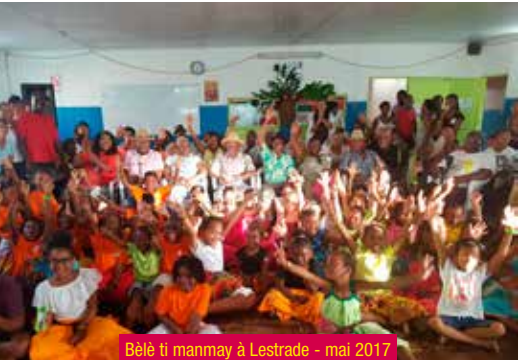
Bèlè ti manmay à Lestrade - mai 2017