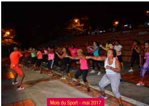
Mois du Sport - mai 2017