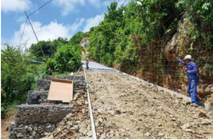
Réfection de la route de Moise

La Ville travaille pour vous au cœur de vos quartiers !