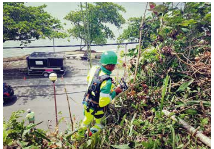
Elagage dans les quartiers