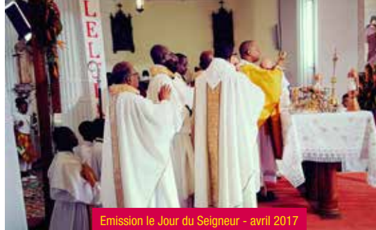
Emission le Jour du Seigneur - avril 2017