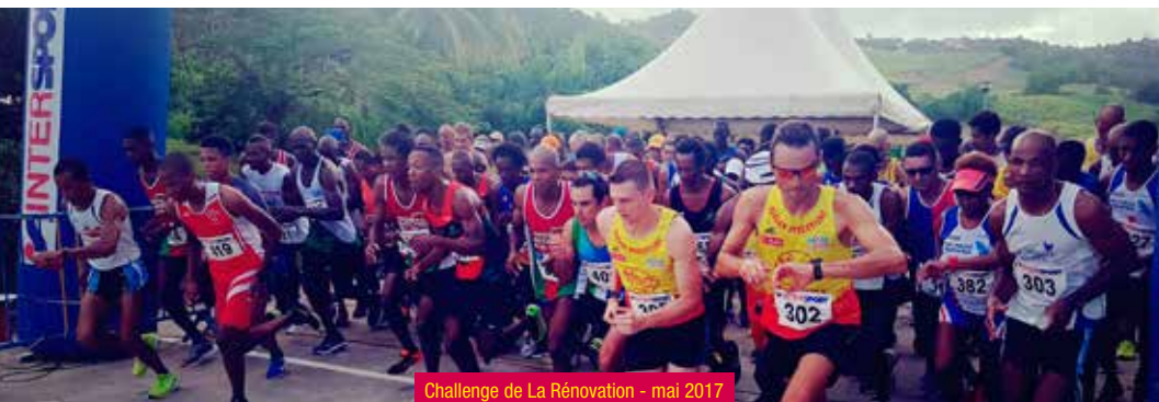
Challenge de La Rénovation - mai 2017