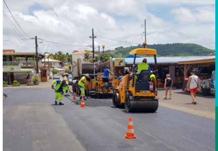
Travaux d'enrobé sur le Boulevard Henri Auzé

Coût des travaux : Canalisation : 96 521€ HT - Réfection: 17 0304€ HT