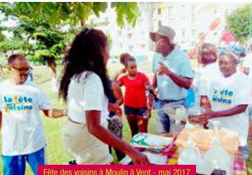
Fête des voisins à Moulin à Vent - mai 2017