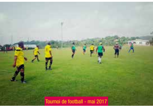
Tournoi de football - mai 2017