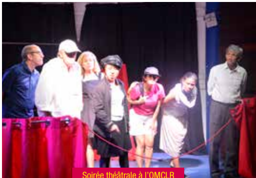
Soirée théâtrale à l'OMCLR