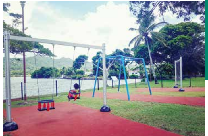
Aire de jeux de la place des cités unies.