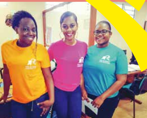
Les jeunes du service civique à la disposition des parents

L'éducation de nos enfants : une priorité