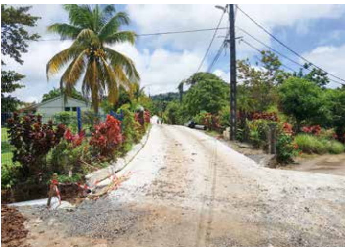
Réfection d'une route à Moulin à Vent 3