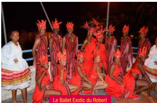
Le Ballet Exotic du Robert